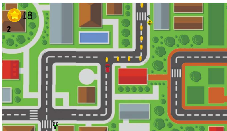
Figura 1. Cenário do jogo.

Para auxiliar o jogador, um personagem caracterizado como um guarda de trânsito o ensina as regras de trânsito (Figura 2). Diante disso, o jogador deve respeitá-las, para que consiga avançar até o seu destino. Caso o jogador desrespeite alguma norma de trânsito, é levado ao reinício do jogo, em que deve observar novas orientações do guarda de trânsito, na tentativa de reforço ao aprendizado.