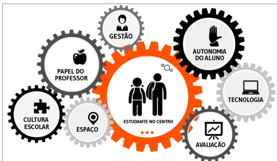
Figura 1 - Imagem elaborada para um especial do Porvir 7 , em que foram compartilhados cada um dos desafios elaborados para o grupo de experimentações.

Optamos por apresentar “desafios” que continham algumas das propostas do modelo de implementação sugeridas pelo Instituto Clayton Christensen, porém inserimos outras ações que, de acordo com o que identificamos na revisão da literatura, seriam essenciais, como a reflexão sobre os papéis assumidos por alunos e professor em sala de aula, a organização do espaço e a reflexão sobre a importância da avaliação ser utilizada como um recurso para a personalização do ensino (Fig. 1). Esses itens e respectivos embasamentos teóricos foram discutidos no capítulo anterior.