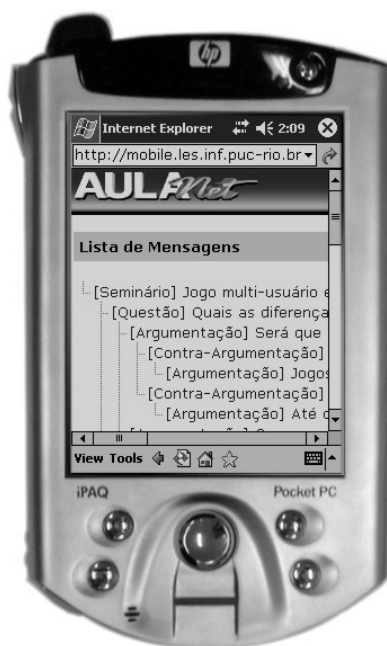
Figura 3. AulaNetM: Tela que apresenta a Lista de Mensagens de uma Conferência

Na segunda versão do AulaNetM, foi incluída a tela onde é apresentada a estrutura de árvore da conferência (figura 3), reproduzindo a que já existe no AulaNet (figura 1). A tela que apresenta a mensagem com links para a mensagem precedente e para suas respostas foi mantida, possibilitando uma alternativa de navegação na conferência.