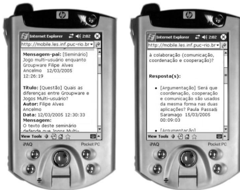
Figura 2. As meta-informações da mensagem precedente e das respostas são mostradas, respectivamente, (a) antes e (b) depois da mensagem propriamente dita

As conferências acessadas pelos entrevistados foram da edição 2004.1 do curso TIAE. O tamanho e o título das mensagens deste curso eram relativamente grandes para o espaço da tela dos PDAs, sendo por isto uma base de dados apropriada para os testes. Os valores típicos neste curso são de mais de 4 palavras para o título e 3 a 5 parágrafos por mensagem. O tamanho em bytes da página raramente ultrapassa 10Kbytes.