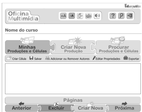
Figura 4. Interface da Oficina Multimídia.

Por fim, e de igual importância, foi dado destaque, ao longo de todo o processo de modelagem e de implementação da Oficina Multimídia, a preocupação com as questões relacionadas à acessibilidade. Além de todo seu desenvolvimento ser alicerçado nas já referidas recomendações propostas pela W3C, a equipe responsável pelo seu projeto teve especial preocupação em oferecer formas alternativas para uso deste recurso por pessoas com algum tipo de necessidade especial. Essa preocupação se concretiza na possibilidade de interação com os recursos da ferramenta por usuários que utilizam apenas o teclado, mesmo nas ações que envolvem disposição espacial de elementos, o que permite seu uso por indivíduos com dificuldades motoras ou deficiência visual (Figura 4). O uso de termos e expressões simplificadas visa evitar a geração de dificuldades para pessoas que não tenham o português (ou demais idiomas oferecidos) como sua língua materna, como é o caso de indivíduos surdos. A utilização de ícones e a tentativa de simplificação máxima das interfaces e da navegabilidade na ferramenta também foram projetadas para evitar a criação de uma sobrecarga cognitiva aos seus usuários. Neste sentido, foram fundamentais os testes de interface realizados com usuários, seguindo as técnicas de prototipação em papel, as quais detectaram possíveis falhas ou pontos de melhorias na proposta de desenvolvimento da ferramenta Oficina Multimídia.