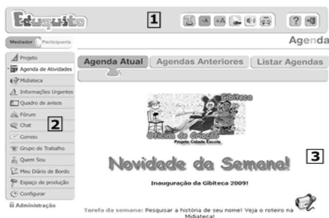
Figura 1. Interface principal do ADA/AVA Eduquito.

O AVA/ADA Eduquito apresenta um conjunto de funcionalidades para mediar tecnologicamente práticas pedagógicas centradas em projetos de aprendizagem. Recursos tecnológicos digitais (de hardware e de software) sintonizados com princípios de acessibilidade e de desenho universal projetam, impulsionam e potencializam a comunicação/interação e construção de conhecimento, ações centradas no aprendiz e, principalmente, nas interações entre os aprendizes mediadas por recursos tecnológicos [Santarosa e Basso 2009]. Diferencia-se dos demais AVA/ADA quanto à concepção e garantia de acessibilidade ao espaço virtual [Santarosa e Basso 2008a], ampliando os recursos para potencializar a interação, o desenvolvimento e a ação sociocognitiva. A interface principal do Eduquito está organizada em três áreas projetadas em sintonia com os princípios de usabilidade, navegabilidade e acessibilidade propostos pela W3C, e do desenho universal (Figura 1): (1) Área superior, contendo a barra de acessibilidade; (2) Área à esquerda, apresentando a barra de ferramentas em que são disponibilizados os recursos tecnológicos para o desenvolvimento dos projetos de aprendizagem e recursos de Tecnologia Assistiva, atendendo à diversidade de usuários com necessidades especiais; (3) Área de conteúdo, espaço que se destina à apresentação do conteúdo correspondente à ferramenta selecionada.